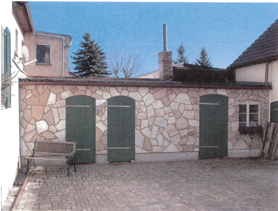
Abb.1: Nebengebäude 1 mit Flachdach

Das Nebengebäude 1 verfügt über drei Abstellräume. Das Dach besteht aus Hohldielen, die mit Dachpappe wetterfest abgedichtet sind.