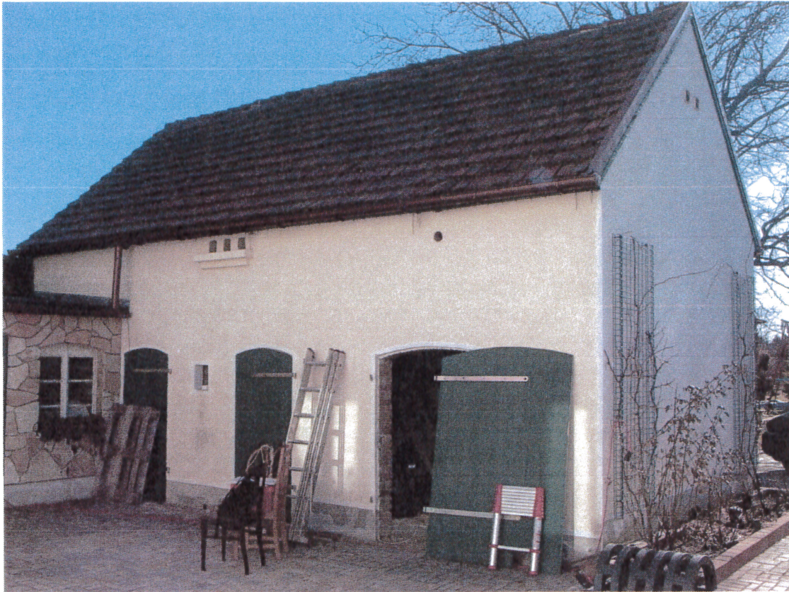
Abb. 2: ehemalige Stallanlage

Das Nebengebäude 2 war ursprünglich als Stallanlage gebaut und genutzt worden. Nach 1990 hat der Eigentümer die Klinkerfassade mit Glattputz versehen.