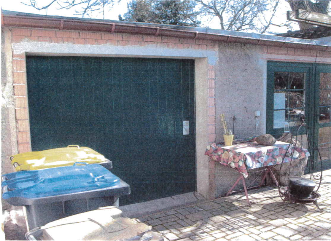
Abb. 3: Nebenglass 3 aus Abstellraum und Sommerküche