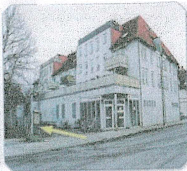
Vorder-/Seitenansicht - Anlieferzone