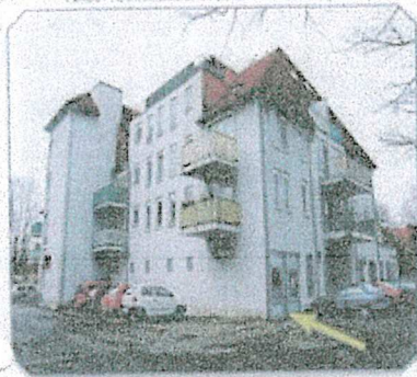
Seiten- Rückansicht - Zugang zur Ladeneinheit