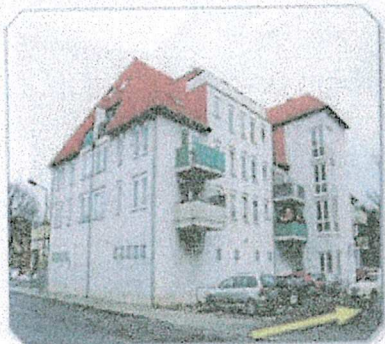
Vorder-/Seitenansicht - Zufahrt zum Park-platz