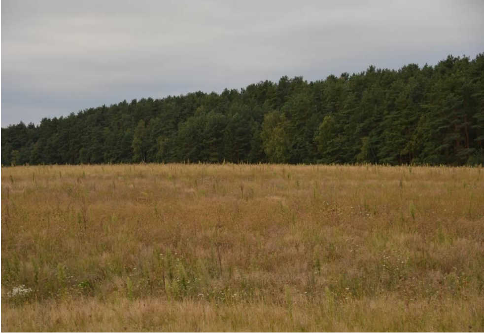
Abb. 10: Blick über die mittlere Photovoltaik-Teilfläche (1)