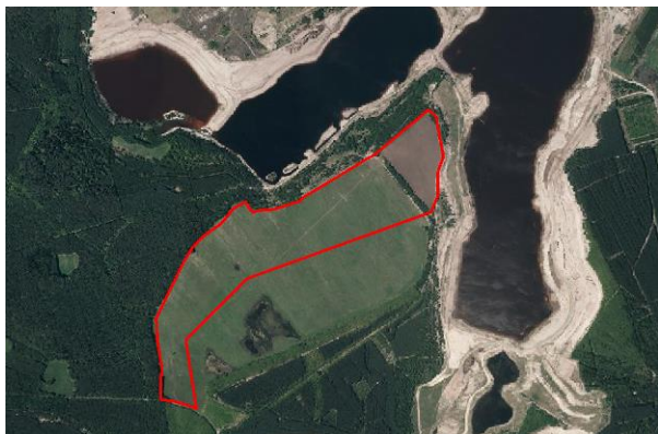
Abb. 5: Luftbild (Brandenburg Viewer 2013)