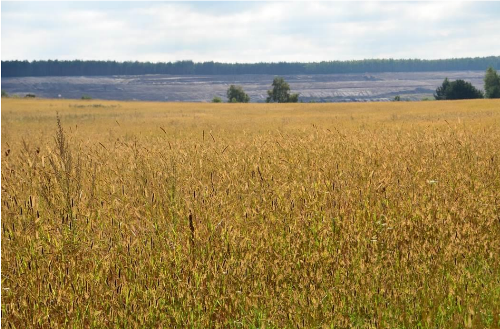
Abb. 8: Nördliche Photovoltaik-Teilfläche, Blick nach Norden / Nordwesten