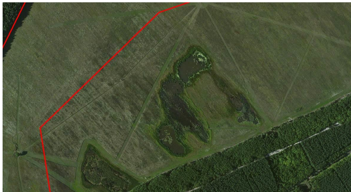
Abb. 7: Luftbild der Kleingewässer östlich des Geltungsbereiches des Vorhabensbezogenen Bebauungsplans