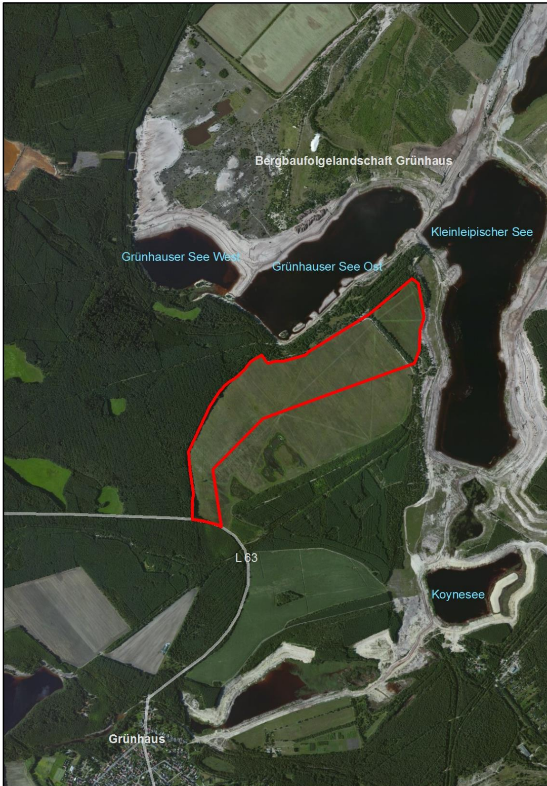
Abb. 1: Lageplan