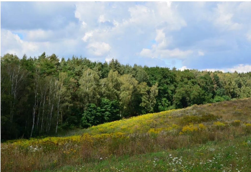
Abb. 13: Blick über die südliche Photovoltaik-Teilfläche von der L63