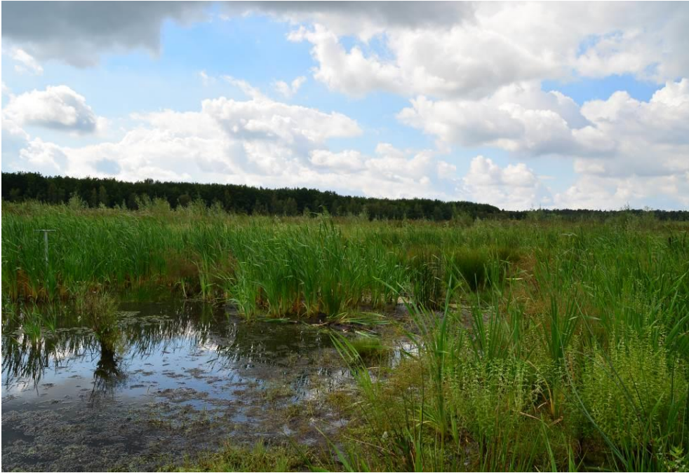
Abb. 16: Kleingewässer (2)