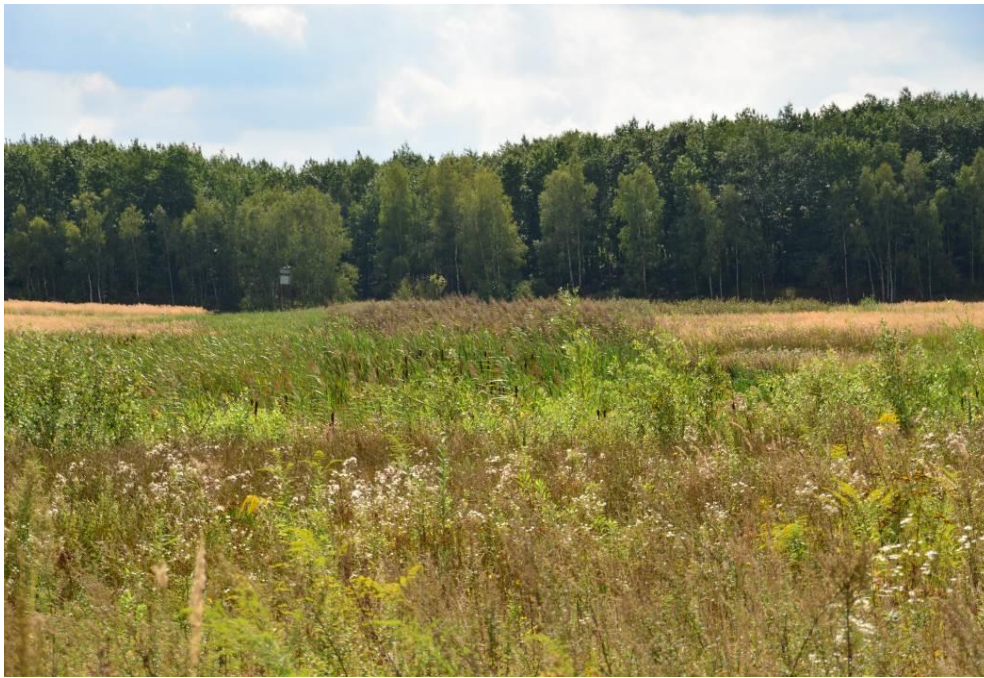
Abb. 14: Blick von der mittleren Photovoltaik-Freifläche auf die Kleingewässer östlich