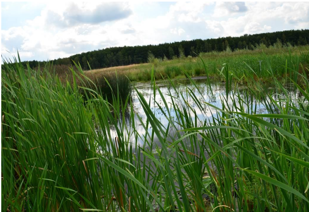
Abb. 15: Kleingewässer (1)