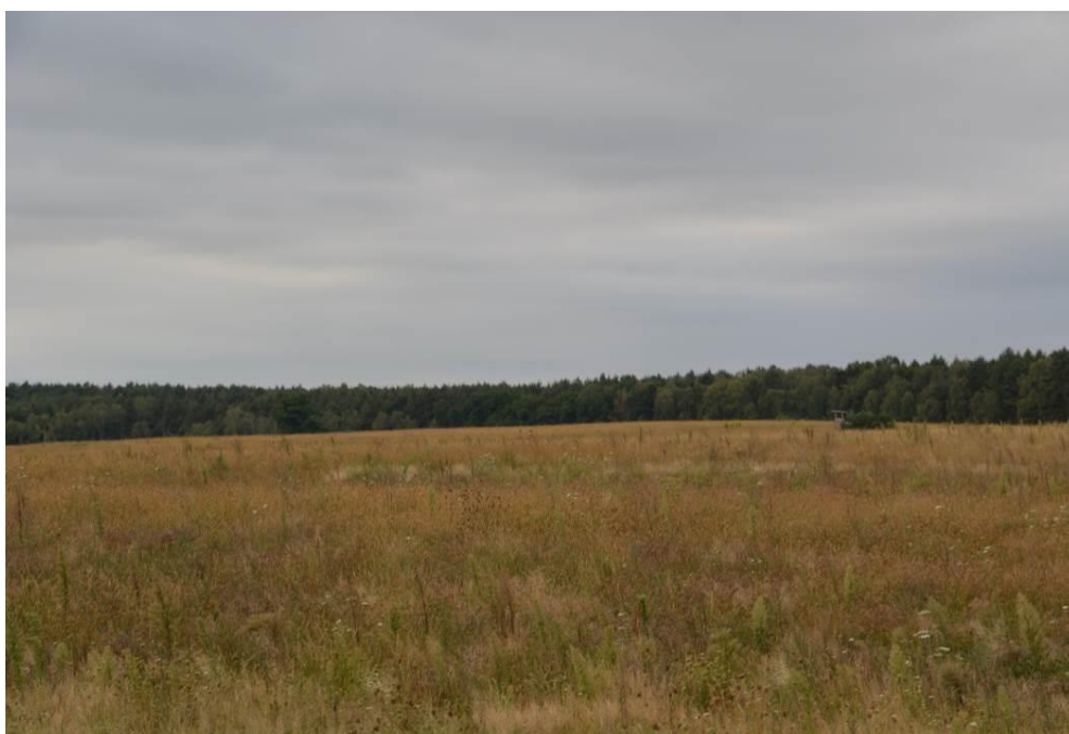
Abb. 11: Blick über die mittlere Photovoltaik-Teilfläche (2)