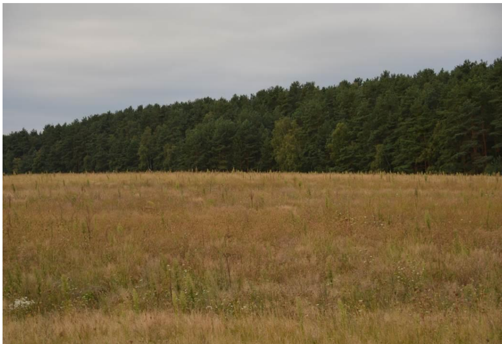
Abb. 10: Blick über die mittlere Photovoltaik-Teilfläche (1)