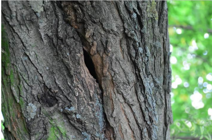
Abb. 2: Robinie mit möglichem Fledermausquartier im Süden des Geltungsbereiches

In der Gesamtbetrachtung ist davon auszugehen, dass das Plangebiet keine hohe oder sehr hohe Bedeutung für die lokale Fledermauspopulation hat.