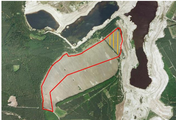
Abb. 3: Luftbild