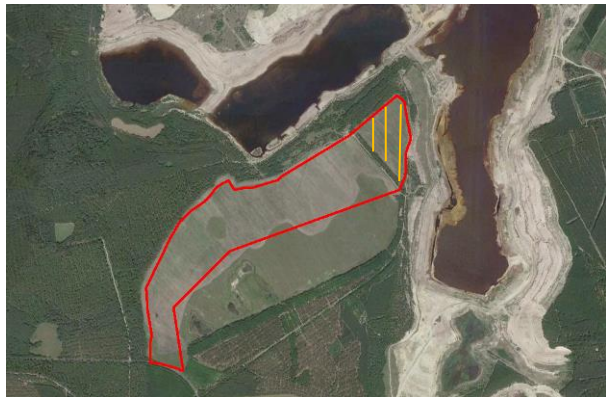
Abb. 6: Luftbild