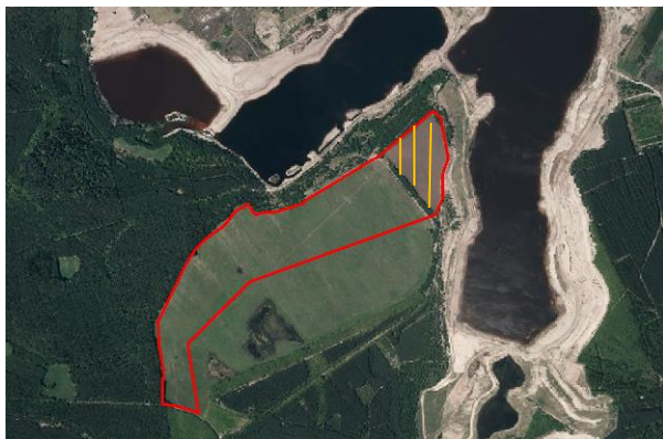
Abb. 5: Luftbild (Brandenburg Viewer 2013)