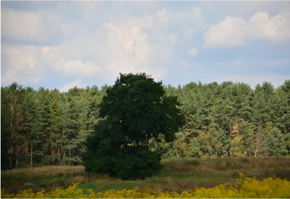
Abb. 12: Robiniengruppe in der südlichen Photovoltaik-Teilfläche