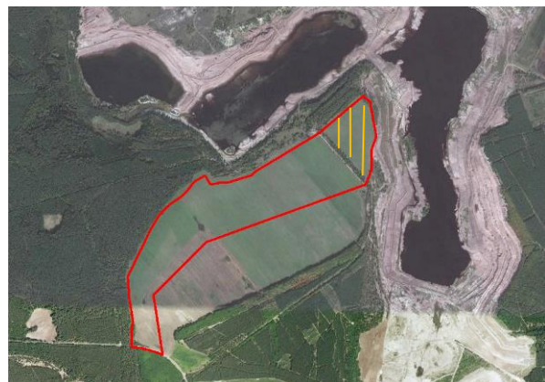
Abb. 4: Luftbild (Google Earth 2009)