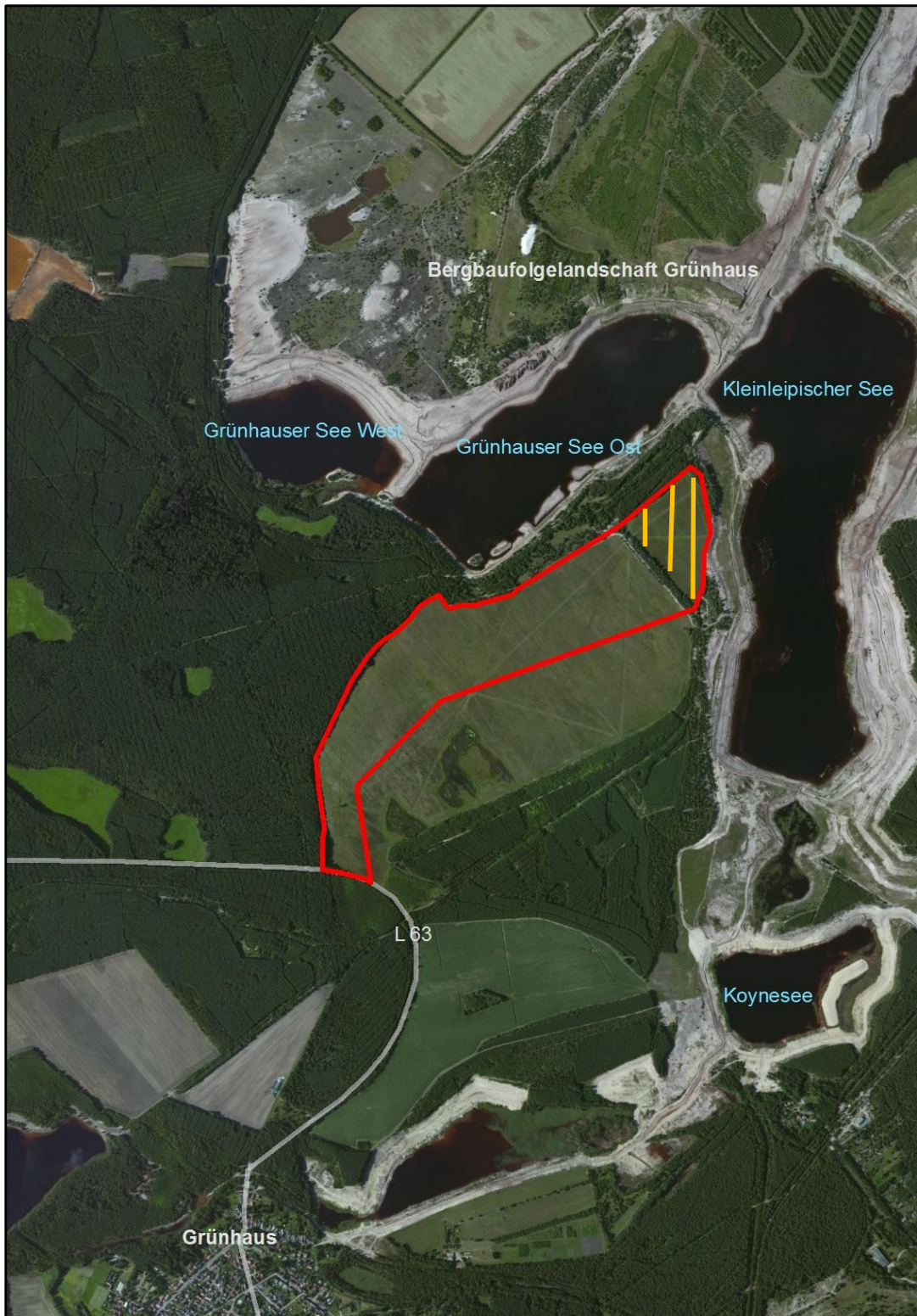
Abb. 1: Lageplan (Stand 2016) (organe - Fläche entfällt 2017)