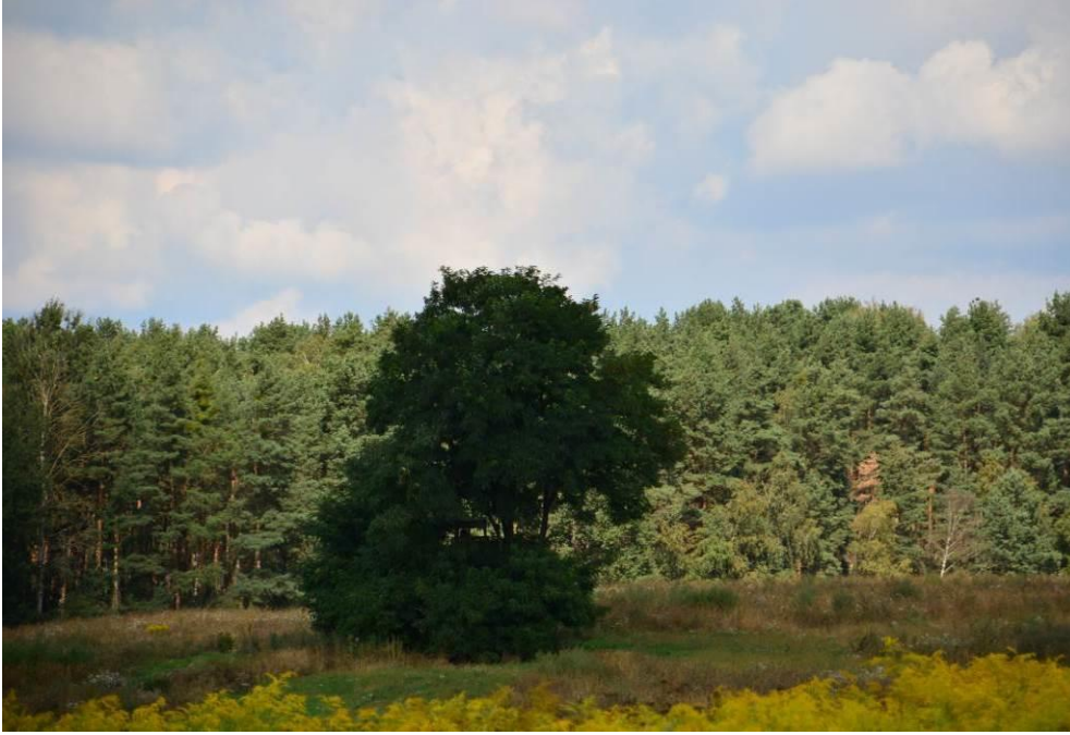
Abb. 12: Robiniengruppe in der südlichen Photovoltaik-Teilfläche