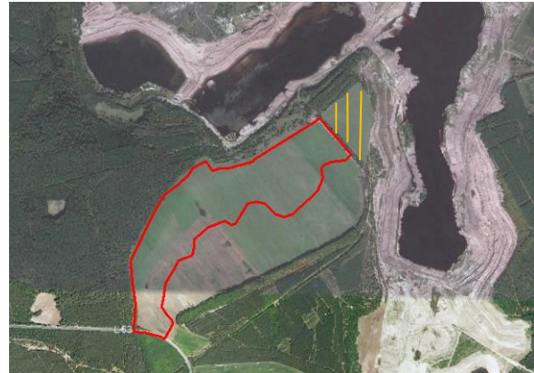
Abb. 4: Luftbild (Google Earth 2009)