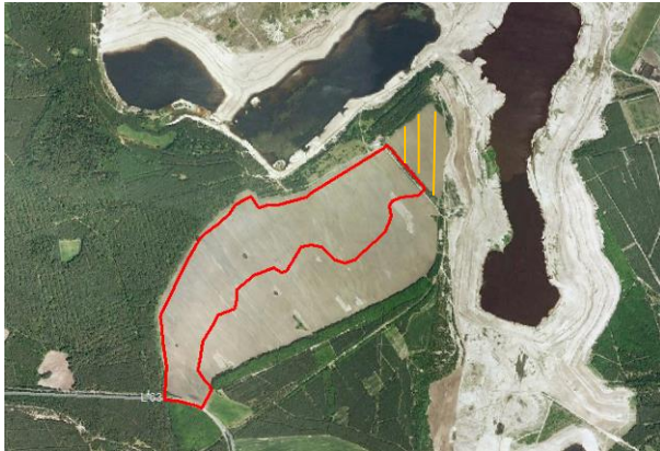
Abb. 3: Luftbild (Google Earth 2008)