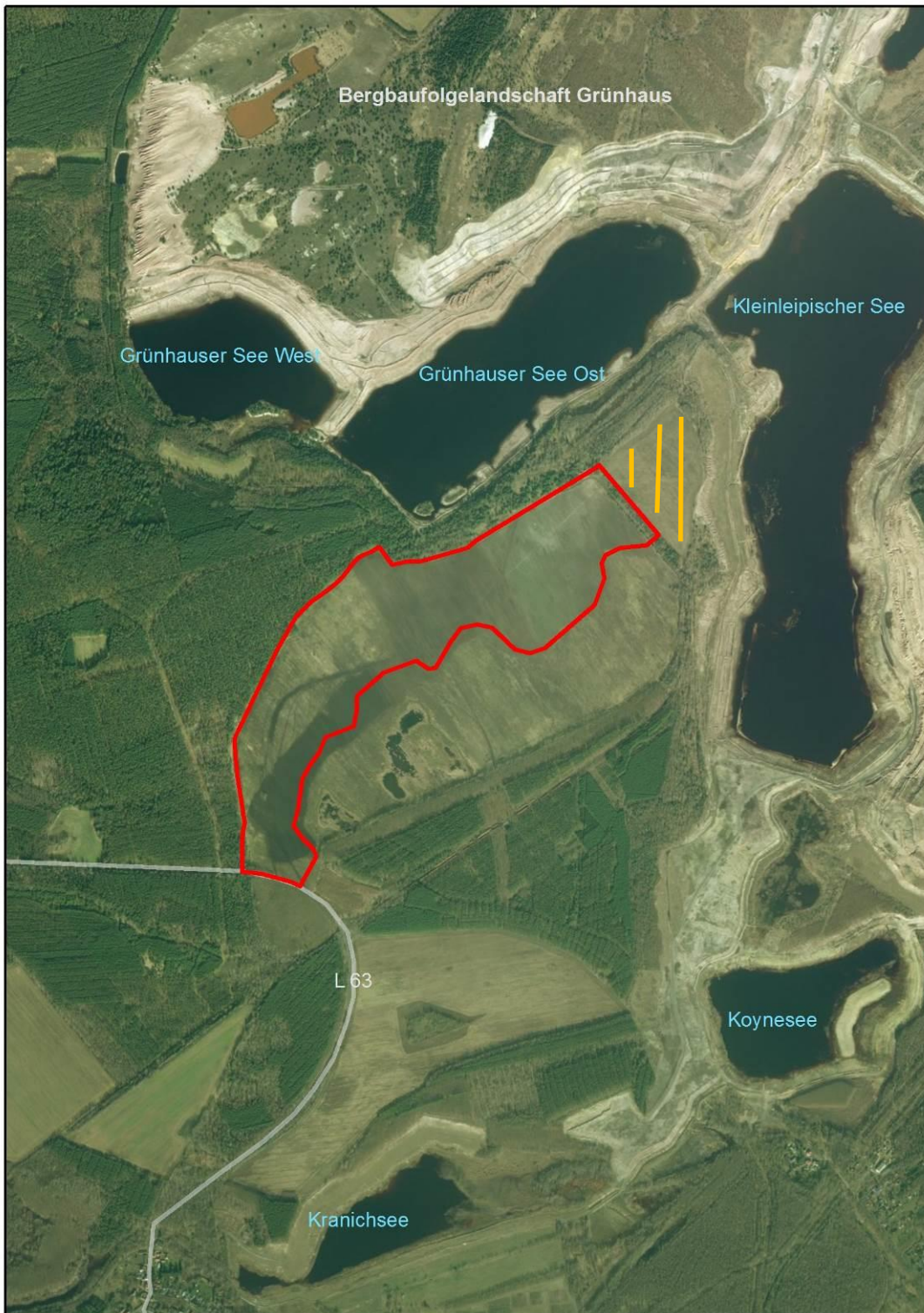
Abb. 1: Lageplan (Stand 2017) (orange - Fläche entfällt gegenüber Entwurf von 2016)