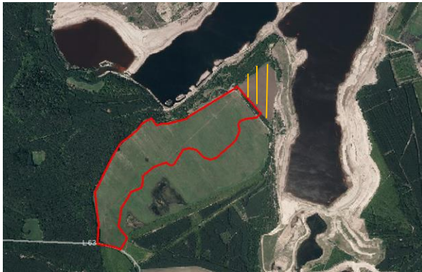
Abb. 5: Luftbild (Brandenburg Viewer 2013)