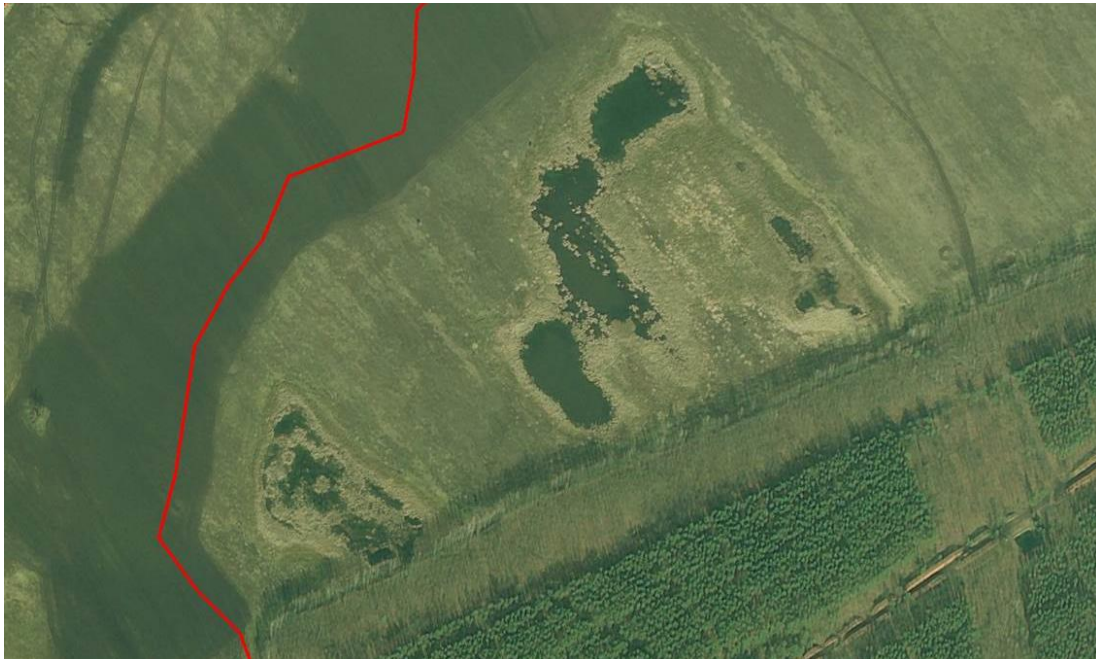
Abb. 7: Luftbild der Kleingewässer östlich des Geltungsbereiches des Vorhabensbezogenen Bebauungsplans