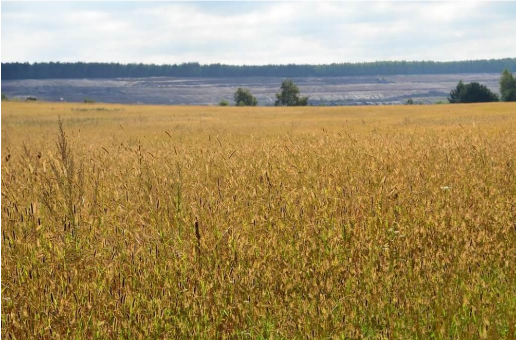
Abb. 8: Nördliche Photovoltaik-Teilfläche, Blick nach Norden / Nordwesten (entfällt 2017)