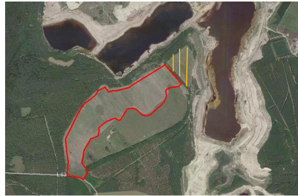
Abb. 6: Luftbild (Google Earth 2015)