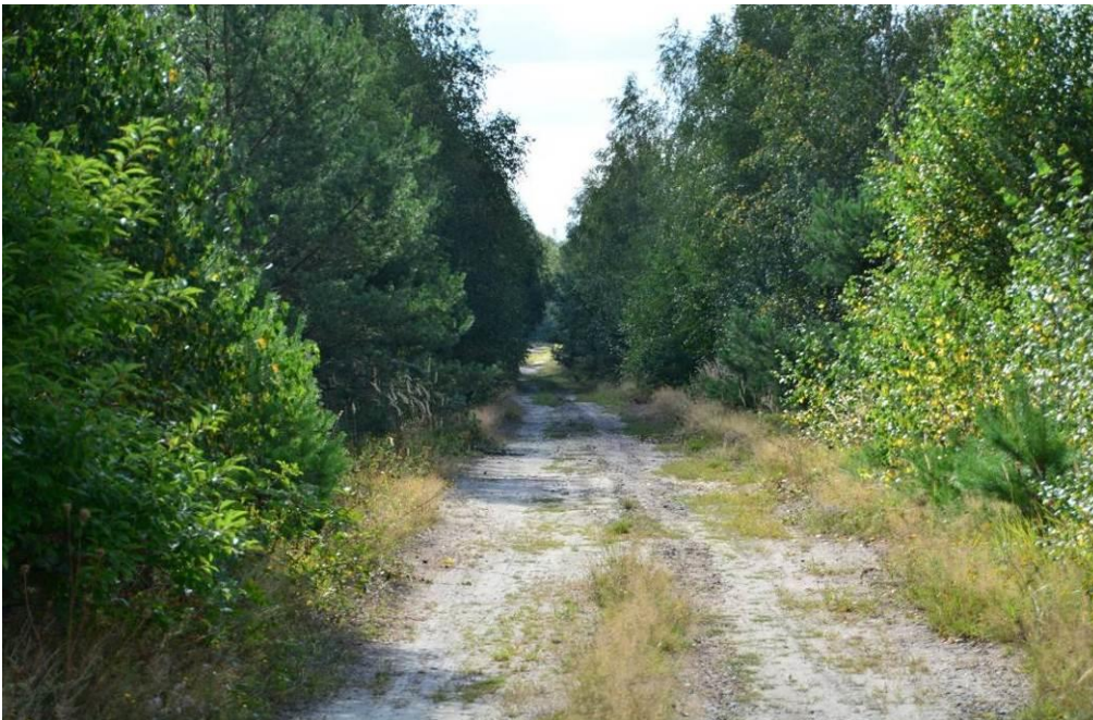
Abb. 9: Weg zwischen nördlicher und mittlerer Photovoltaikteilfläche