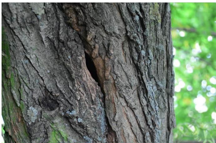
Abb. 2: Robinie mit möglichem Fledermausquartier im Süden des Geltungsbereiches

In der Gesamtbetrachtung ist davon auszugehen, dass das Plangebiet keine hohe oder sehr hohe Bedeutung für die lokale Fledermauspopulation hat.