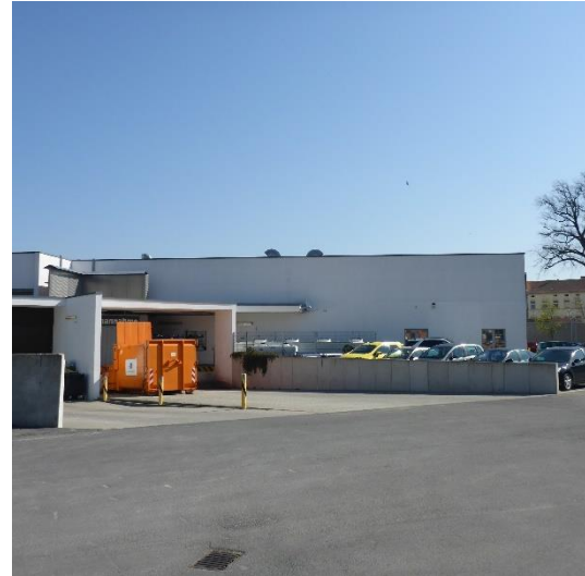
Abbildung 12 Verkehrsflächen (12600000)