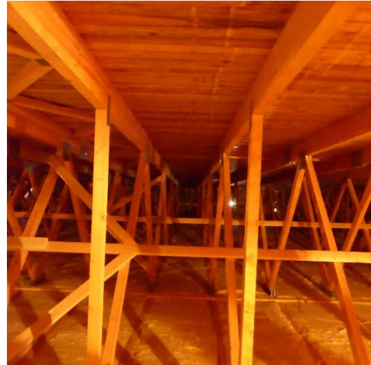
Abbildung 8 Dachstuhl mit Blick Richtung Haupteingang (Nordwesten)

Das Dachgeschoss des Gebäudes wird nicht genutzt, der Dachstuhl ist vollständig aus Holz bietet möglicherweise Hangplätze für Fledermäuse sowie Nistmöglichkeiten für Brutvögel.