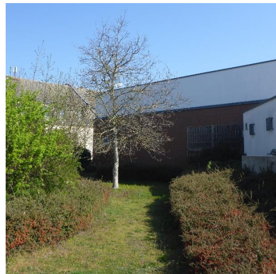
Abbildung 14 Anpflanzung von Sträuchern < 1m Höhe); mit Bäumen (10271200)