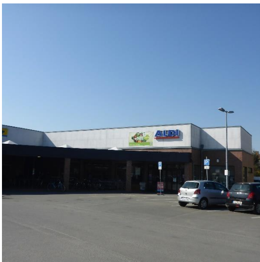
Abbildung 9 Blick auf den Haupteingang von Nordwesten aus

Das Dachgeschoss des Gebäudes wird nicht genutzt, der Dachstuhl ist vollständig aus Holz bietet möglicherweise Hangplätze für Fledermäuse sowie Nistmöglichkeiten für Brutvögel.