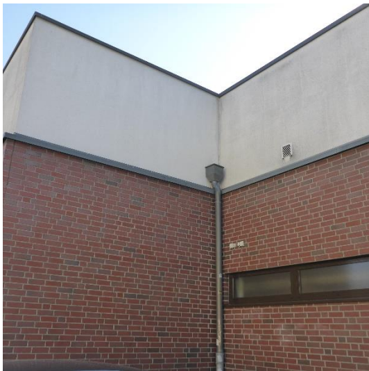
Abbildung 16 Beispiel für Fassade zwischen Erdgeschoss und Dachstuhl, keine Spalten vorhanden

Im Zuge der Begehung konnten keine Spalten oder Höhlen in der Fassade festgestellt werden, welche Quartierpotential / Nistplätze für geschützte Arten bieten. Im Dachstuhl konnten keine geschützten Arten bzw. Spuren festgestellt werden.