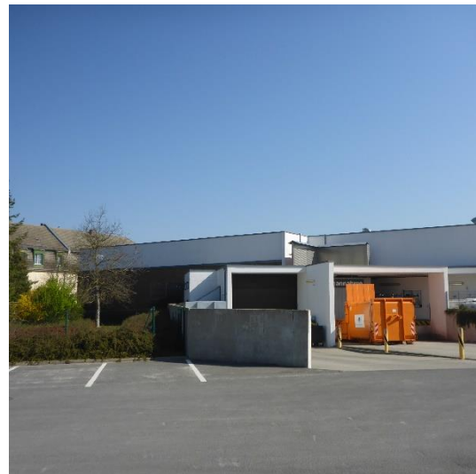
Abbildung 6 Gebäude von Südwesten