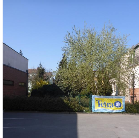
Abbildung 4 Nordseite des Gebäudes in westliche Richtung