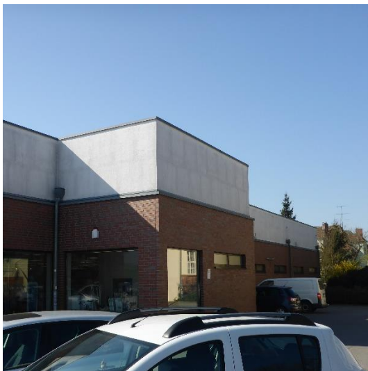
Abbildung 13 Industrie-, Gewerbe-, Handels- und Dienstleistungsflächen (in Betrieb); mit geringem Grünflächenanteil (12312000)