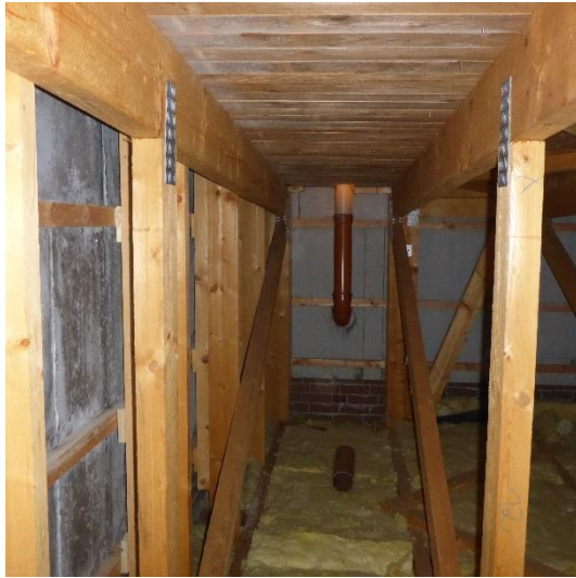
Abbildung 19 Detailansichten vom Dachstuhl. Es konnten keine geschützten Arten nachgewiesen werden