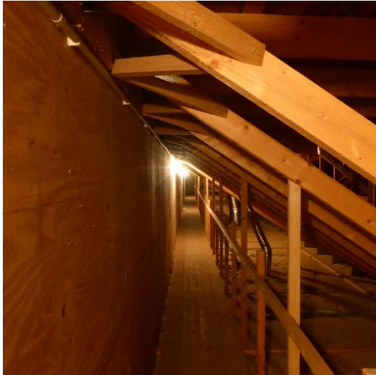
Abbildung 7 Dachstuhl an der Grenze zum benachbarten EDEKA-Supermarkt