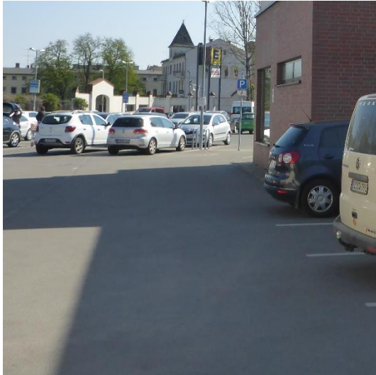
Abbildung 11 Parkplätze versiegelt ohne regelmäßigen Baumbestand (12643200)