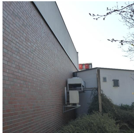
Abbildung 17 Gebäudefassade im Bereich der Lüftungsanlage. Es wurden keine Nistmöglichkeiten und Spalten bzw. Zugänge festgestellt