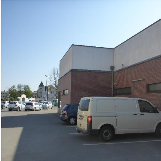
Abbildung 3 Nordseite des Gebäudes mit Blick gen Osten

durch entsprechende Bauzeitenregelung ausgeschlossen werden müssen, wurde auf eine Besichtigung verzichtet.