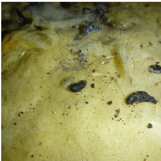
Abbildung 18 Rattenkot und -falle. Rattenpräsenz minimiert die Wahrscheinlichkeit der Anwesenheit geschützter Brutvogelarten.