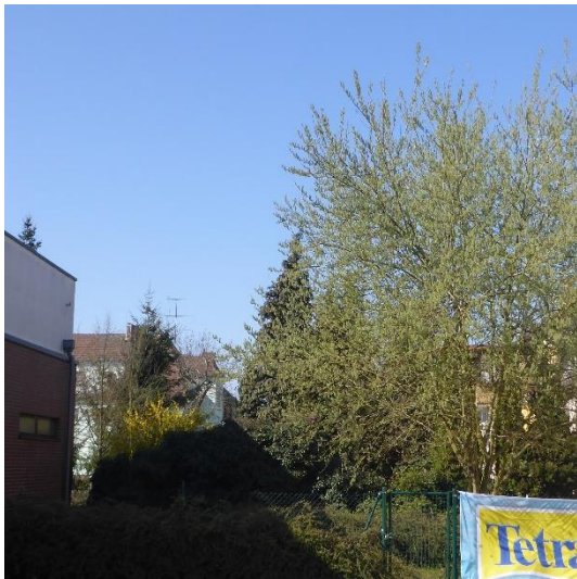
Abbildung 15 Anpflanzung von Sträuchern (> 1m Höhe); mit Bäumen (10272200)