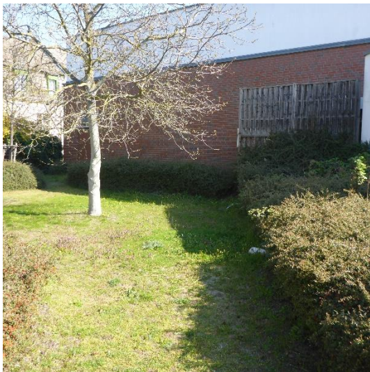
Abbildung 5 Westseite des Gebäudes