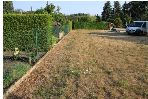
Abb. 3: offengelassener Grünlandbereich (Nachbargrundstück, außerhalb des UG)