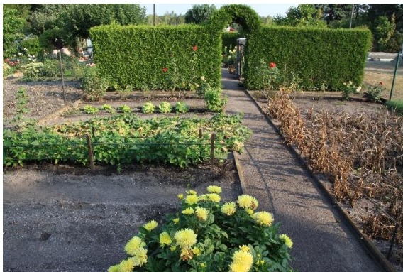
Abb. 2: Intensiv genutzter Kleingarten

Als Untersuchungsraum für den vorliegenden ASB wird für den überwiegenden Teil der Artengruppe der Geltungsbereich des B-Planes zuzüglich eines Puffers von 20 m zugrunde gelegt.