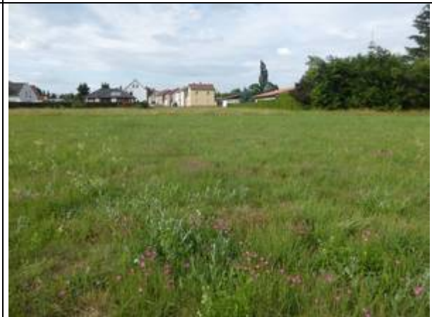
Foto 4: Heidenelken-Grasnelkenflur im Trassenbereich der KMR-Rohrleitung (Foto: Wiesner, 24.6.20)