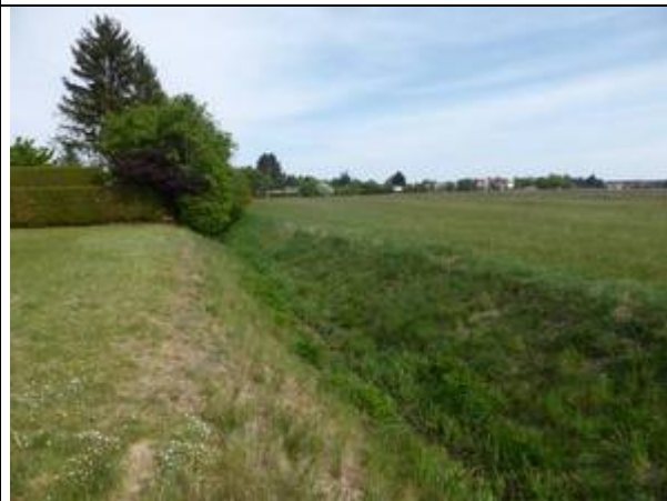
Foto 5: für die KMR-Rohrleitung zu querender Tollergraben (Foto: Wiesner, 9.5.20)