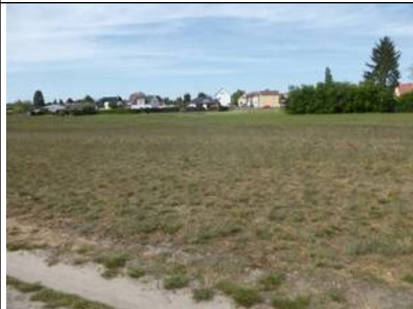
Foto 3: Grasnelken-Raublattschwingelrasen im Trassenbereich der KMR-Rohrleitung (Foto: Wiesner, 9.5.20)