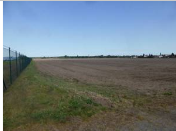
Foto 1: Schwarzacker – Aufstellbereich der Solarthermiekollektoren und PV-Module (Foto: Wiesner, 6.5.20)