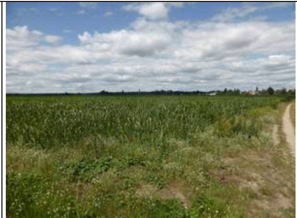
Foto 2: Maisacker - Aufstellbereich der Solarthermiekollektoren und PV-Module