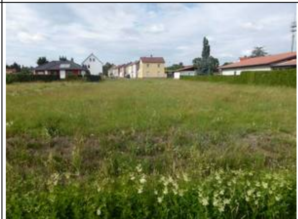
Foto 6: Mädesüßflur im Tollergraben und Frischwiese im Trassenbereich der KMR-Rohrleitung (Foto: Wiesner, 24.6.20)