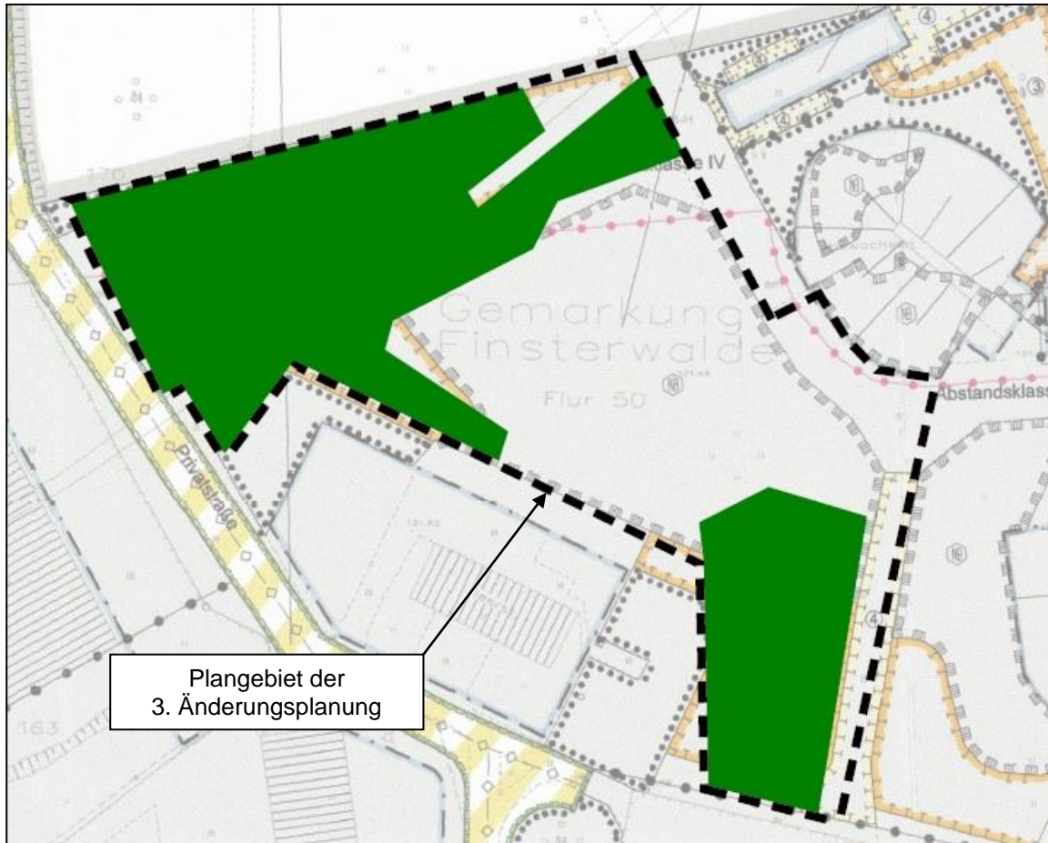
Abbildung 2: Wald innerhalb des Plangebietes (grüne Darstellung)